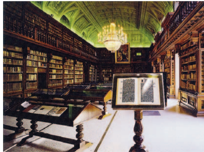
La Biblioteca Braidense di Milano, una delle più prestigiose d'Italia