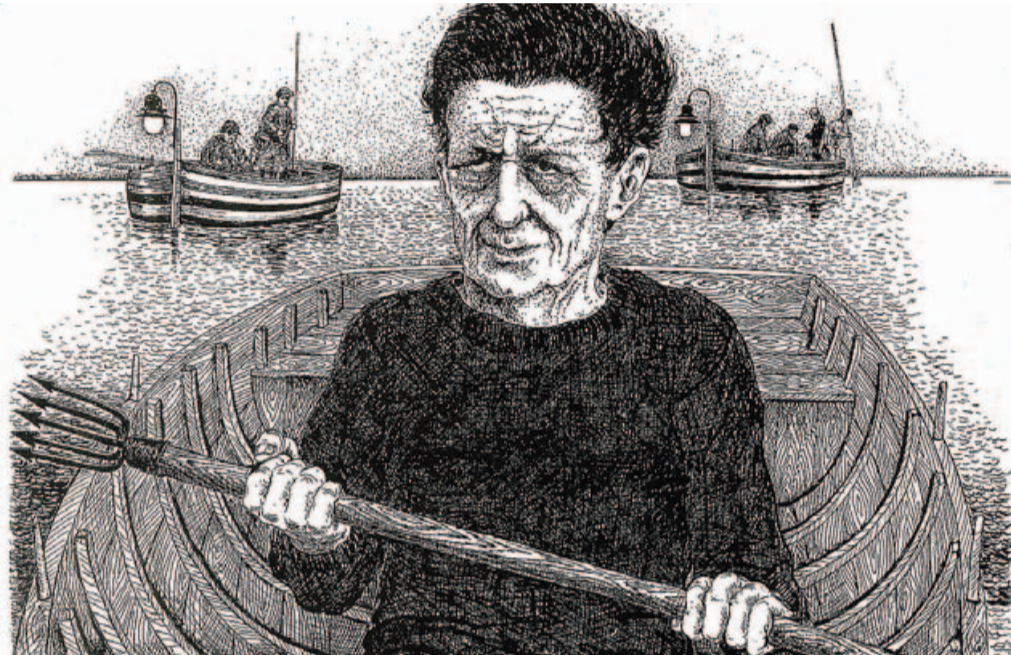
Lo scrittore Stefano D'Arrigo in un disegno a china del 1998 del pittore Bruno Caruso

Poi, dopo la sua morte nel 1992, toccò a Jutta, gelosa custode delle memorie del marito, mantenere il riserbo sulla vita del giovane D'Arrigo come se lo scrittore avesse cominciato ad avere esistenza letteraria a partire dal secondo dopoguerra con le prime prove dell' Horcynus , romanzo dalla lunghissima e tormentata gestazione che pubblicò nel 1975